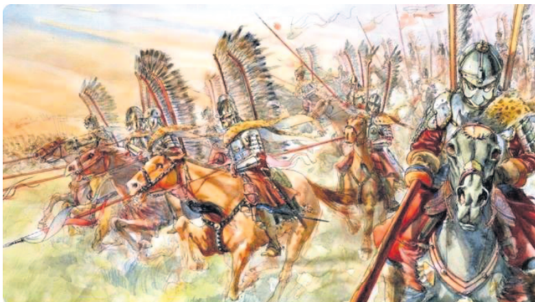
Sparnuotųjų husarų ataka.

1584 m. kovo 17 d. nustatyta tiksliai Biržų Radvilų valdų šiaurinė riba – Nemunėlio upė. Ši siena, dabar virtusi Lietuvos ir Latvijos riba, beje, yra viena iš seniausių