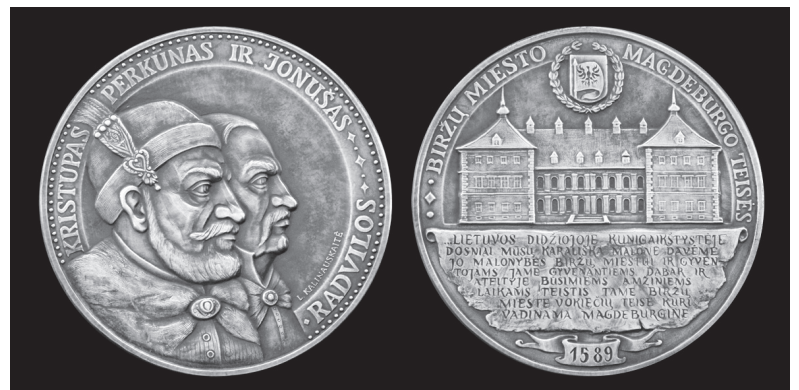
Kristupas Perkūnas ir Jonušas Radvilos. Medalis.

mėnesio Radvilos Perkūno kariuo-menė nukeliavo beveik tūkstantį kilometrų, kelis kartus susikaudama su rusais ir teriodama didesnę nei Lietuva teritoriją.